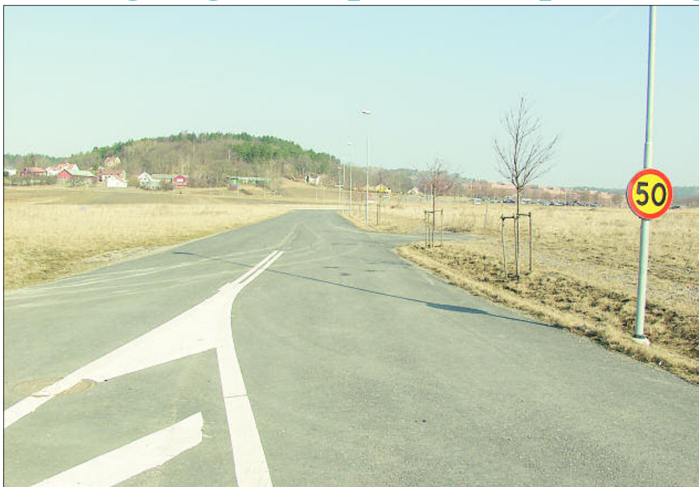
Vägen till framtiden är utstakad. Ett utvecklingscenter mitt emellan SCA i väster, Glaxo Smith Kline i söder och AstraZeneca i öster.