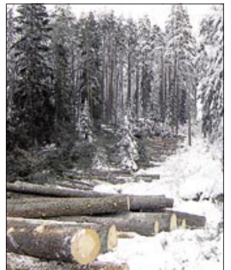
Vattenfall Service Syd har förstärkt närmare 200 kilometer elnät de senaste fem åren i Tierp.