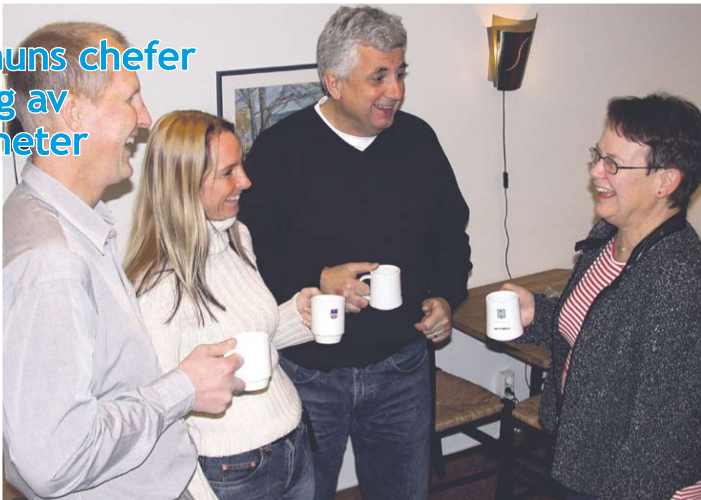
Mår man bra presterar man bättre. En god arbetsmiljö frigör engagemang, arbetsglädje och goda idéer.

Projektets teoretiska grund, baserat på kognitiv psykologi och prestationspsykologi, har varit att må bra och prestera väl. I en god arbetsmiljö skall alla medarbetarna känna sig delaktiga, ges ansvar och möjlighet att växa - en utveckling även kopplad till utförda häl-