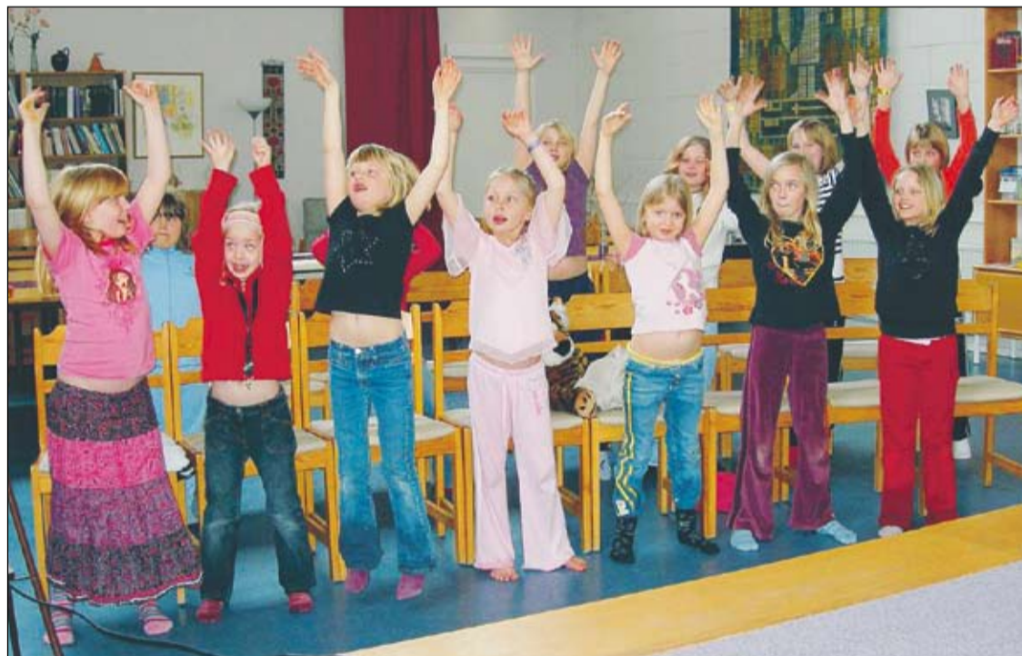
Barnkören i Kolbäck sjunger upp. Efter uppsjungingen blir det ofta sånger utan långa verser och med enkla repetitioner. Härmsånger lär de sig fort.

Barn är ofta stressade. Vi brukar ha en stund då de får ligga och lyssna och slappna av när vi berättar en historia.