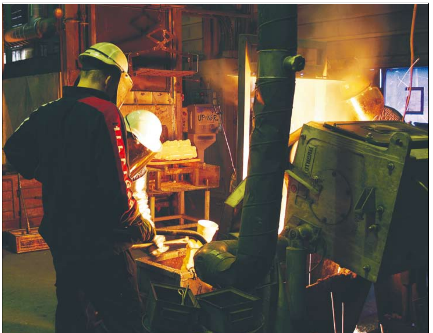
TPC:s styrka är personalens utarbetade kompetens inom precisionsgjutning.

Tel: 0220-219 00 • Fax: 0220-172 11 info@tpcab.se • www.tpcab.se