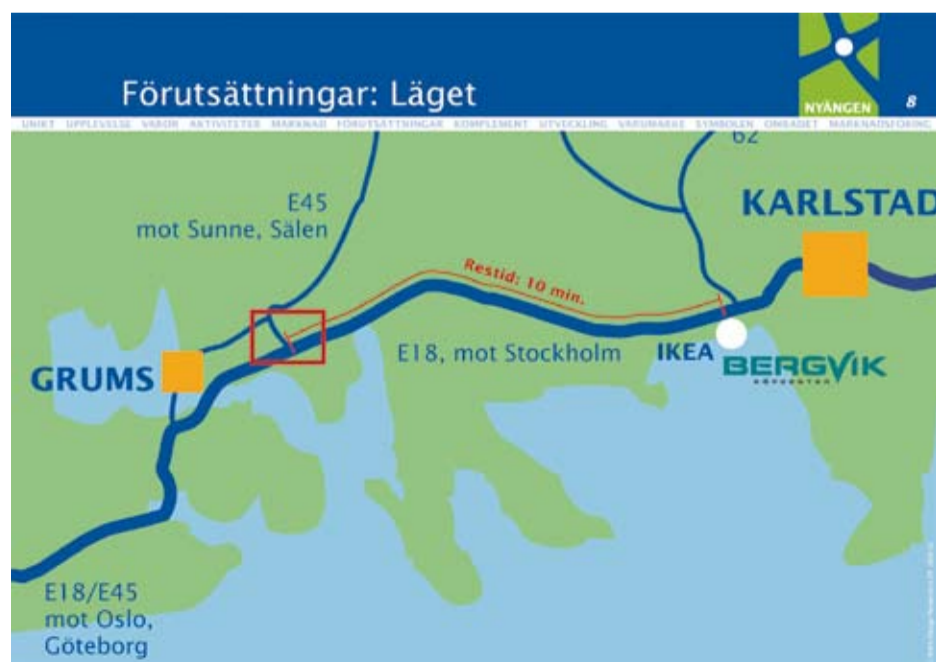
Nyängen – ett nytt handelsområde för större sällanköpsvaror vid knutpunkten mellan E18 och Riksväg 45 i Grums. Marken är detaljplanerad och klar för etablering.