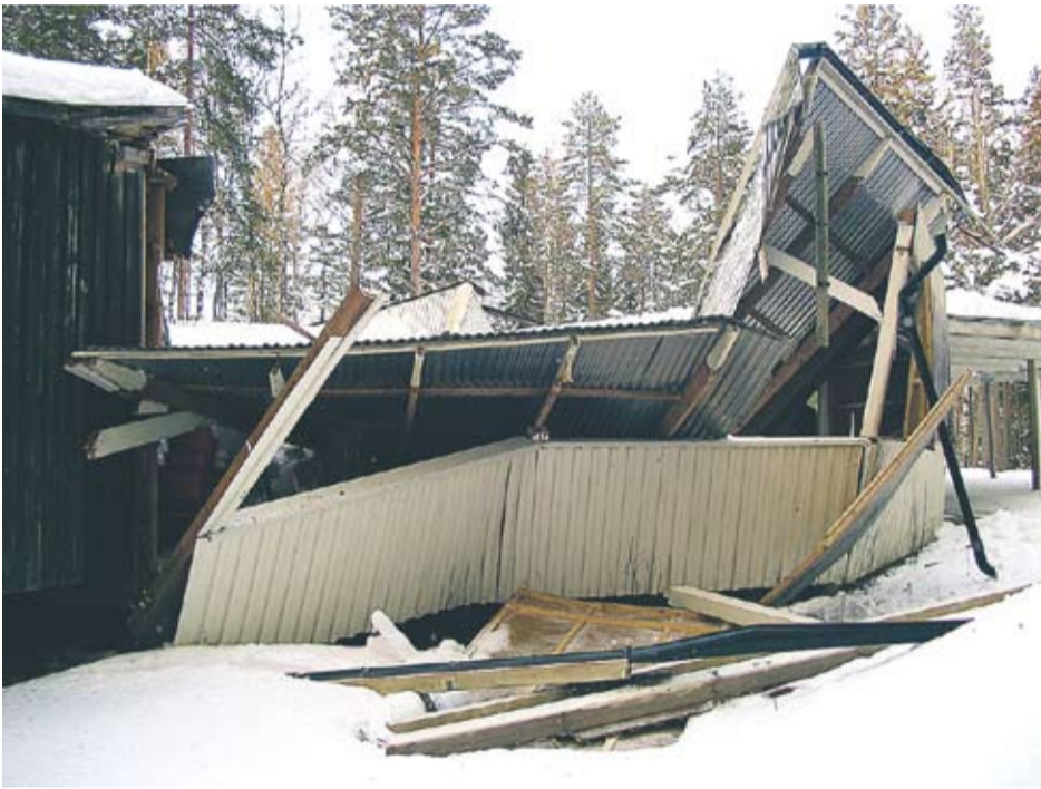
I vintras fick snömassorna taket på Skruvstadsparkens dansbana att rasa in. Då trodde ingen att det skulle gå att reparera.