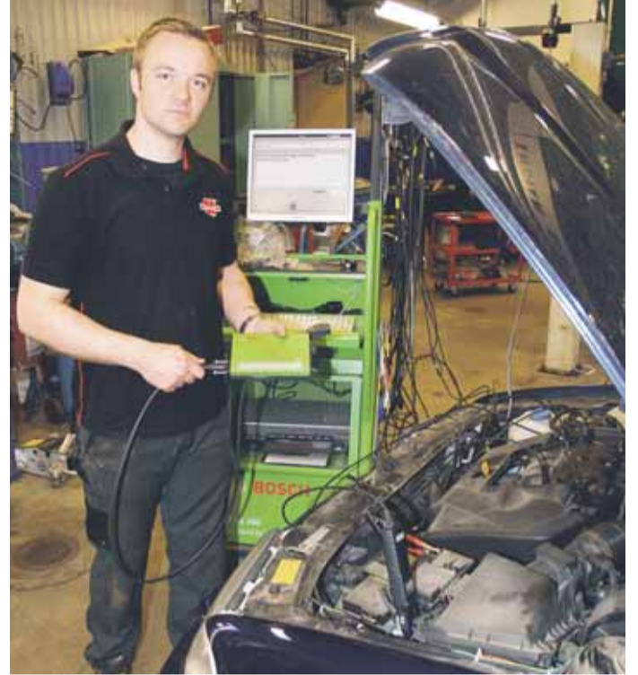
"Vi investerar i Bosch datoriserade felsöknings- och diagnosutrustning – vi kan därmed utföra avancerad och effektiv felsökning på alla nya bilmodeller"