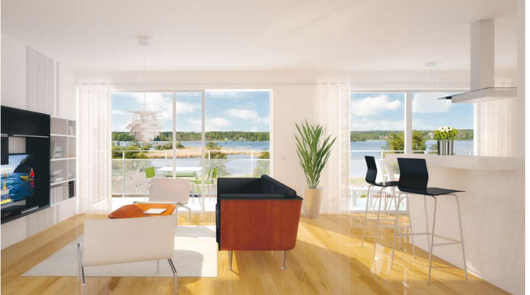
Utsikt över Vassbotten, farleden och Karls Grav. Interiör från lägenhet på fjärde våningen, Roddaregatan. Illustration: Contekton Arkitekter.

Sugen på solterass i västerläge? Utsikt över farleden? Nära till strandpromenaden? Då kan du läsa vidare.