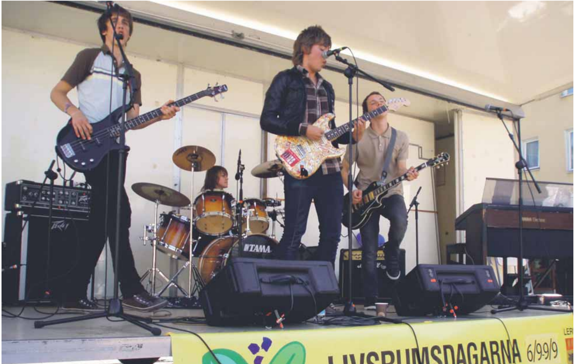
Livsrumdagarnas höjdpunkt är den årliga Torgfesten i Lerum, i år lördagen 8 september. Då kan alla som vill låta sig inspireras.

Årets Livsrumsdagar i Lerum är längre, större och mer spännande än någonsin.