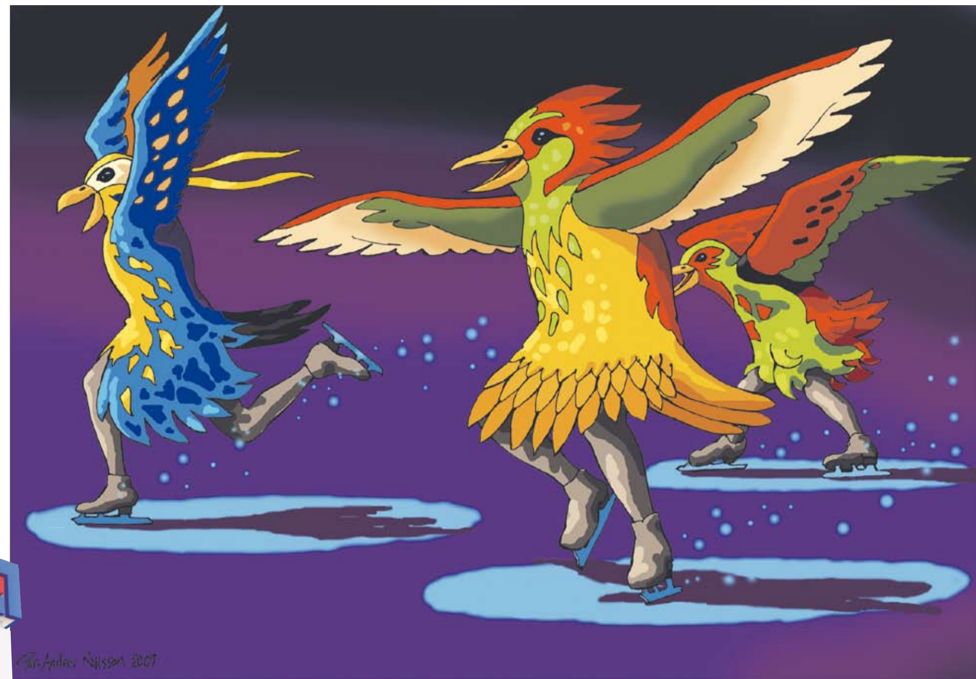
Förvänta dig det oväntade med föreställningen Drömläge – ett allkonstverk om Vänersborg och dess invånare. Med Drömläge invigs Arena Vänersborg.