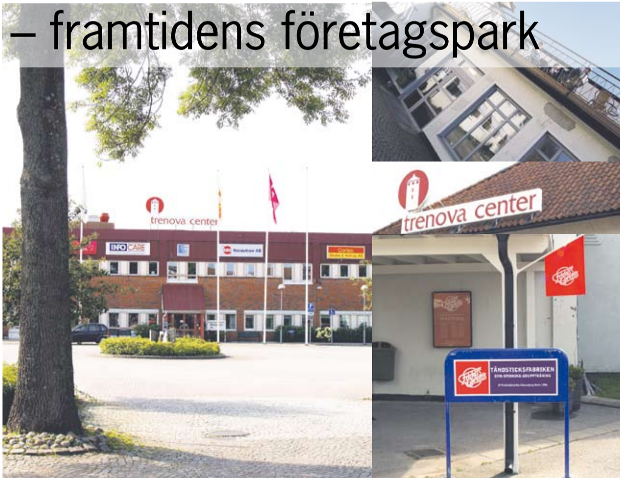
Trenova Center kan erbjuda gemytliga, moderna och kundanpassade lokaler ett stenkast från stadskärnan och Vänernsregionen.

Större delen av Trenova Center är i dag fullt uthyrt. Genom att kontinuerligt utveckla Trenova Center kan man nu erbjuda